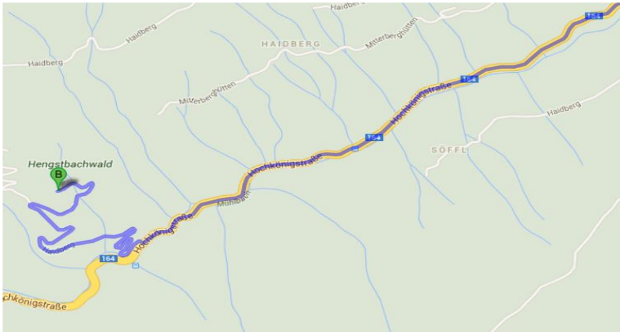
Abbildung: Abzweigung auf den Güterweg Unterfasching